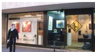
La galleria "Thuillier" di Parigi, nel cuore del quartiere "Le Marais" a pochi passi dal Museo Picasso