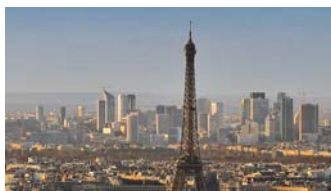
Veduta di Parigi con l'inconfondibile Torre Eiffel

A seguito del notevole successo della passata edizione, alla cui pubblicazione era stato abbinato il concorso di Bruxelles, anche quest'anno rivolgiamo la nostra attenzione al palcoscenico artistico estero oltre che come di consueto allo scenario italiano. Galleristi, mercanti e collezionisti di tutta Europa consultano annualmente "Avanguardie Artistiche".