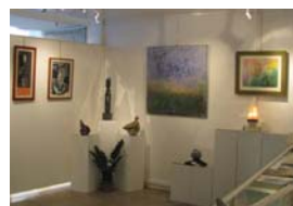
Alcuni ambienti della Galleria Thuillier di Parigi

NESSUN ANTICIPO ! PAGAMENTO IN CONTRASSEGNO AL RICEVIMENTO DELLE PUBBLICAZIONI.