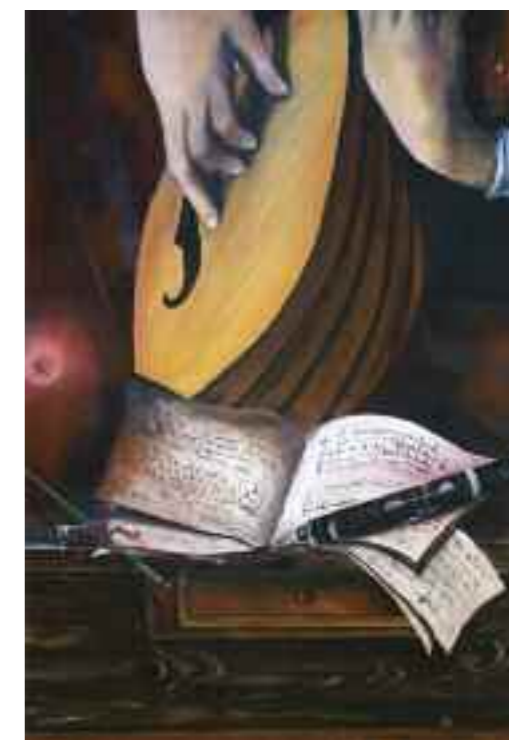
L'opera, di Renzo Tonello, vincitrice del sesto premio