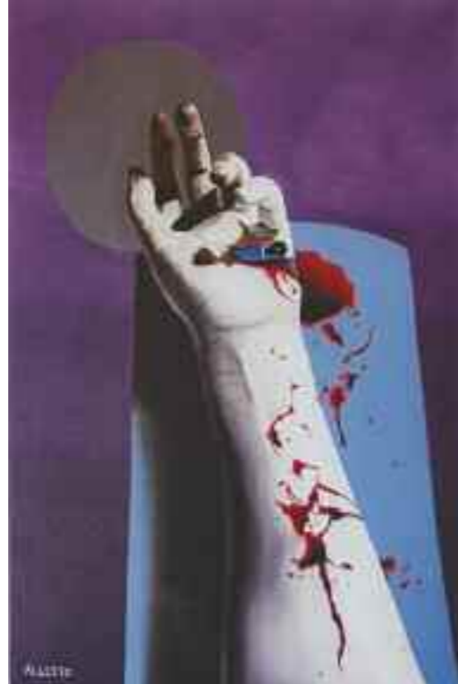
L'opera, di Giuseppe Alletto vincitrice del decimo premio