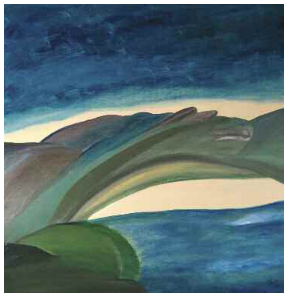
L'opera, di Osvalda Pucci, vincitrice del quarto premio