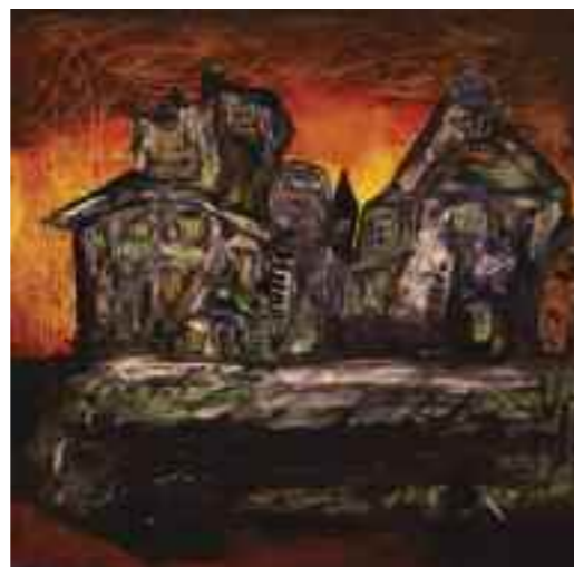
L'opera, di Iole Grossi, vincitrice dell'ottavo premio