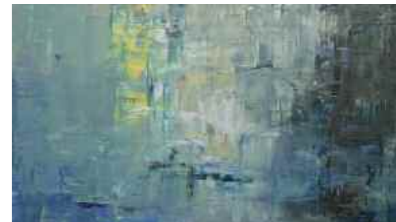
L'opera, di Salvatore Saccà, vincitrice del primo premio assoluto