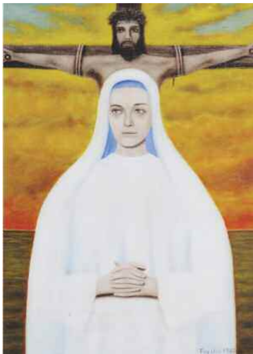
L'opera, di Piercarlo Fayella, vincitrice del terzo premio