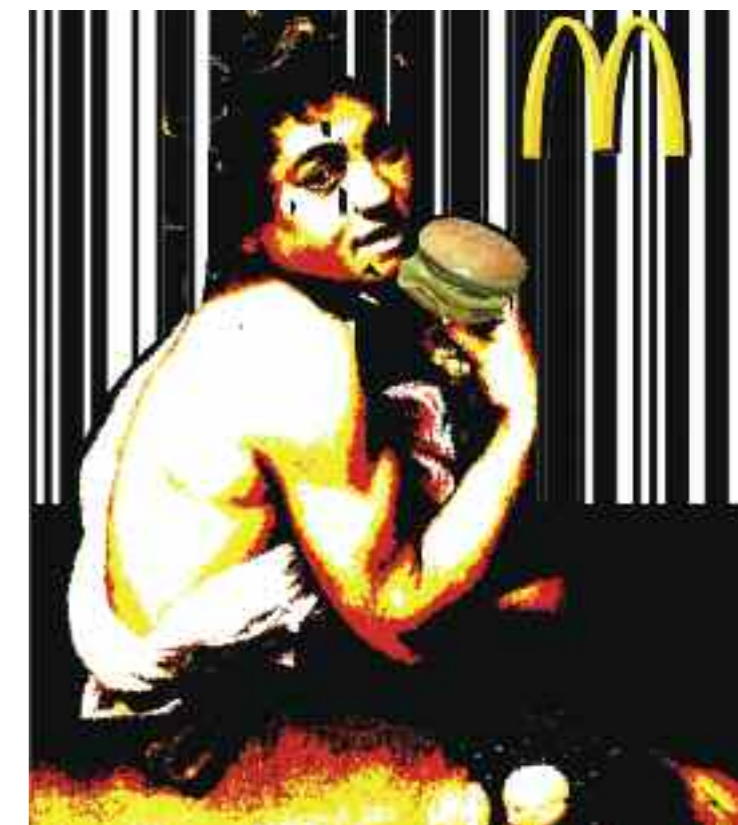
L'opera, di Albert Zuber, vincitrice del secondo premio