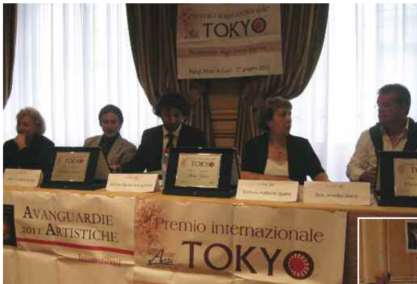
Il tavolo dei giurati